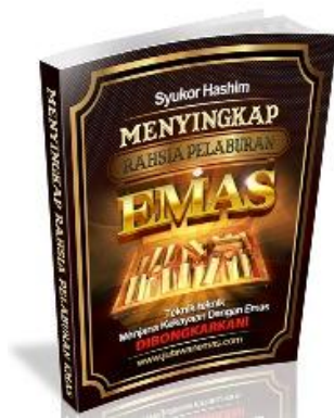
Panduan Terbaik Pelaburan Emas di Malaysia (RM80)

http://bit.ly/ebookgold (Klik link di atas)