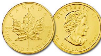
Emas di UOB Bank (jenama antarabangsa)