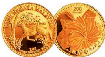
Syiling Kijang Emas (dijual di Maybank)

(1) Kijang Emas Bank Negara, (2) Emas UOB Bank, (3) Emas Public Gold. Selain tiga ni, ada banyak lagi, tapi ini yang paling berkredibiliti di Malaysia.