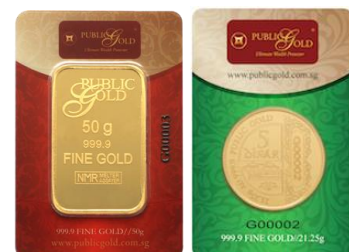
Emas Public Gold (standard LBMA)