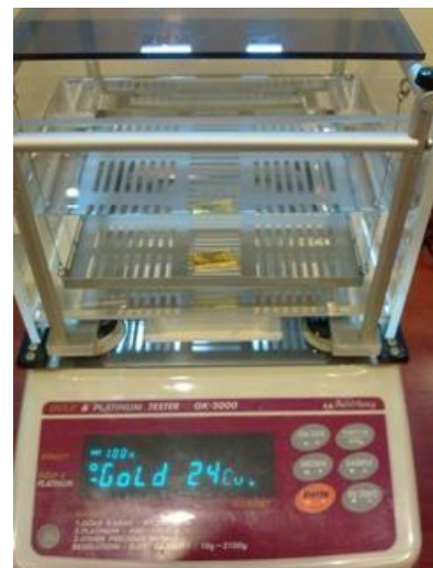
Ketulenan emas diukur menggunakan densimeter. Boleh test di kedai emas, Ar-Rahnu atau pejabat Public Gold.